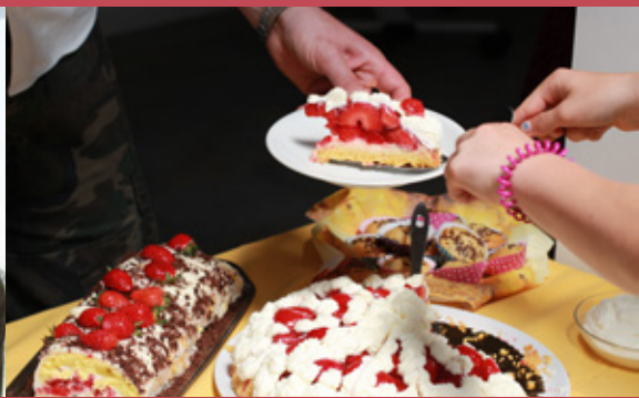
Viel Hitze & Kuchen, Luftballons & eine Hüpfburg auf dem Gemeindefest