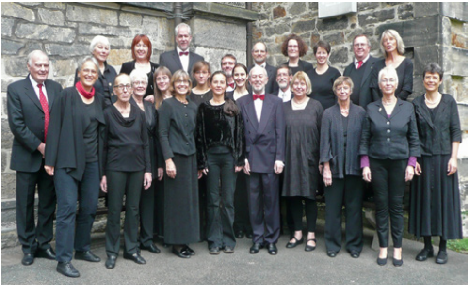
Kammerchor ars musica zu Gast in St.Marien