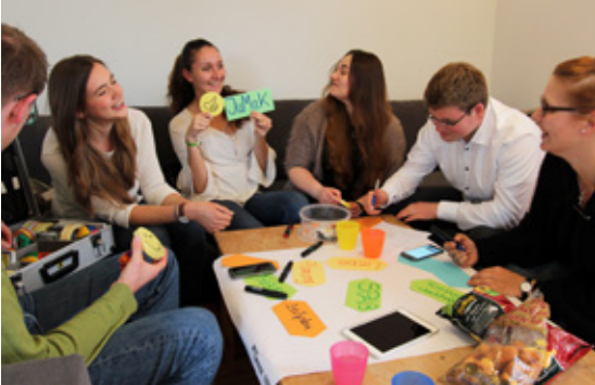
Der JuMaK bei einem Vorbereitungstreffen

Der Jugendmitarbeiterkreis (JuMaK) lädt zu seinen Veranstaltungen ein. Weitere Infos unter www.stmarien-isernhagen.de