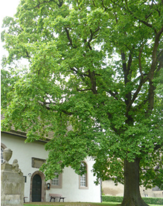
Die Luther-Eiche in Polle lieferte die Samen für die Pflanzaktion zum Reformationsjahr 2017

Die St.-Marien-Kirchengemeinde erhält anlässlich des 500. Reformationsjubiläums eine Luther-Eiche. Die feierliche Pflanzung am 11. November findet im Rahmen des Gottesdienstes zum Kindergarten-Lichterfest um 16.30 Uhr am Gemeindehaus (Martin-