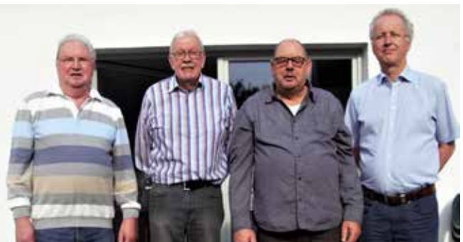
Alte und neue Leitung