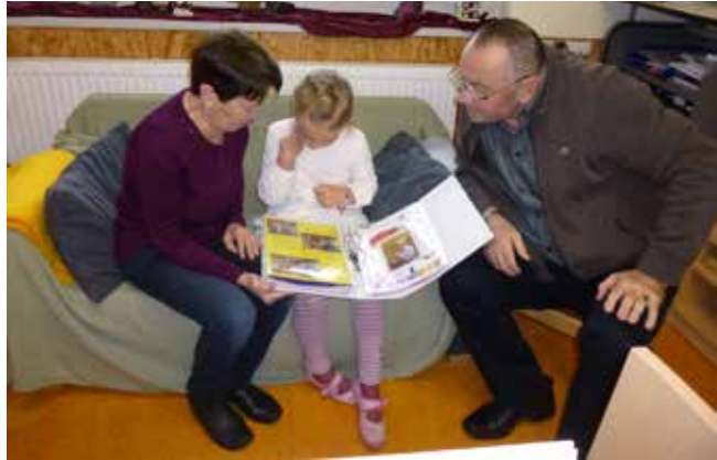
Großeltern tag

Ganz rasant folgt nun der Großeltern tag. Hierzu laden wir die Großeltern der Kinder-gartenkin-der am 7. Dezember in die Kita ein. Es gibt Kaffee und Kuchen und jede Menge Aktionen, die die Großeltern gemeinsam mit ihren Enkel-kindern erleben können. Und auch hier beschließen wir den gemütlichen Vormittag mit stimmungsvoller Weihnachtsmusik.