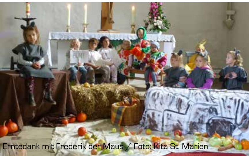
Erntedank mit Frederik der Maus

Gemeinsam sangen wir Laternenlieder, Lieder vom Mann im Mond und natürlich von der Moorhexe mit ihrem roten Ringelstrumpf.