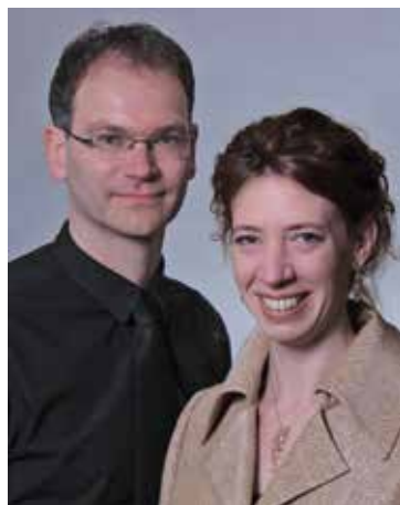
Martin Schulte und Sandra Engelhardt

Im März werden die Sänger aus Bulgarien ein Konzert in unserer Kirche geben. Näheres in der nächsten Brücke.