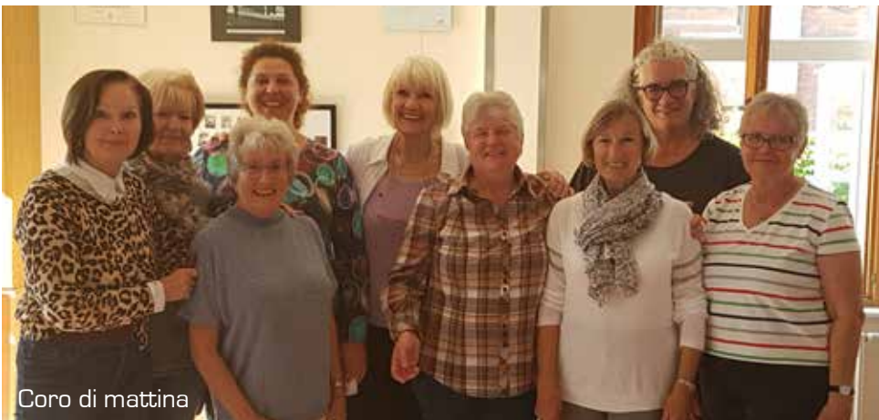
Coro di mattina

Volkstümliche Lieder aus der Heimat, rund um die christliche Seefahrt und Weihnachten.