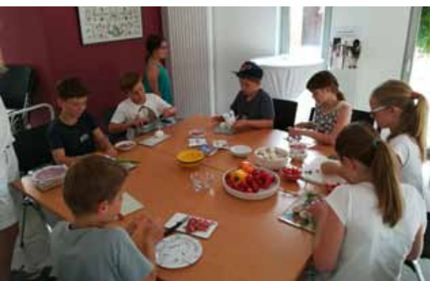
Vorbereitungen für Pizza und Cocktails

Auch im nächsten Jahr wird es wieder Angebote der Ev. Jugend im Sommerferienpass geben. Dann werden auch gezielt die jüngeren Kinder in den Fokus genommen.