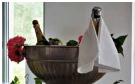
Erdbeerkuchen von Fa. Rathmann, Prosecco am Stiftungsstand