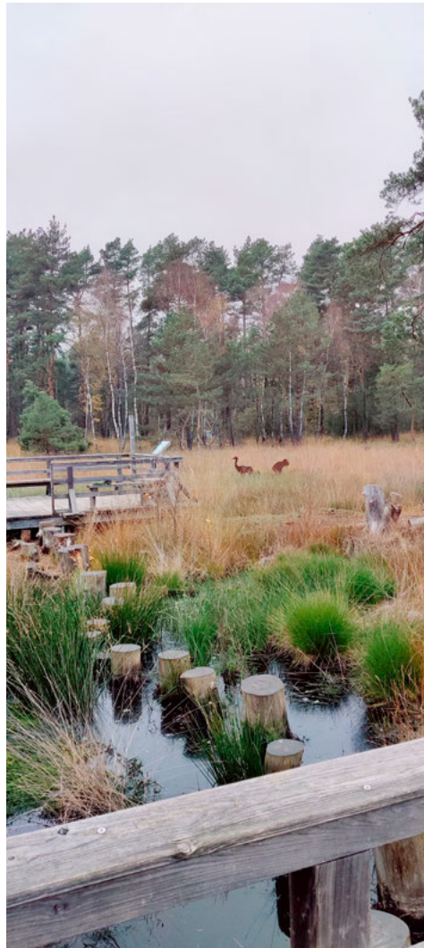
Auf dem Moorerlebnispfad bei Resse

Im Anschluss lädt der Ökumenische Arbeitskreis zu einem kleinen Imbiss und einem Vortrag ein mit dem Thema „Was verbindet uns als Christen und Juden?“