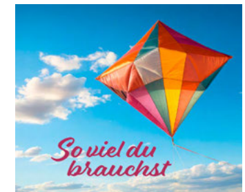
Fastenaktion für Klimaschutz und Gerechtigkeit von Aschermittwoch bis Ostersonntag – 5.3. bis 20.4.2025 –

Wir freuen uns, wenn du uns über deine Fasten-Erfahrungen berichtest: info@klimafasten.de , nutze den Hashtag: #klimafasten oder schick uns eine direkte Nachricht über Facebook oder Instagram!“ Weitere Informationen gibt es auf https://www.kircheundklima.de/klimafasten/