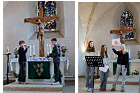
Vorstellungsgottesdienst am 09.02.25 (Konfi-Performance)