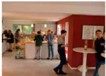
In der „Weihnachtsbäckerei“

Diesen ersten Gottesdienst gestalteten wir zusammen mit dem Orchestrino al Gusto und dem Chor. Orchestrino und Chorgottesdienste gab es auch am 4. Advent – zuletzt mit beiden Chören: Classic und 20:20.