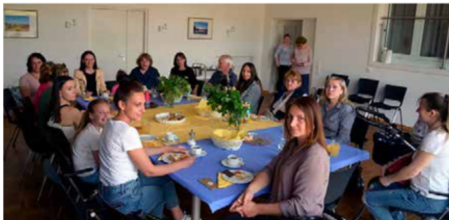
„Blau-gelbes Wohnzimmer“ im Gemeindehaus am Martin-Luther-Weg

Wie schön, dass dieses „Wohnzimmer“ als kleiner „Lichtblick“ für alle existiert!