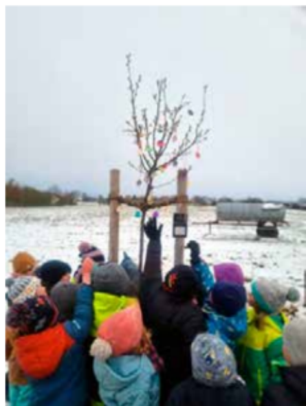
Die Maxis haben Ostereier bemalt und unseren Patenbaum damit geschmückt.