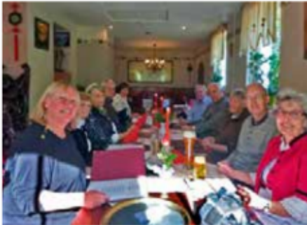
Mit den „Erntefrauen“