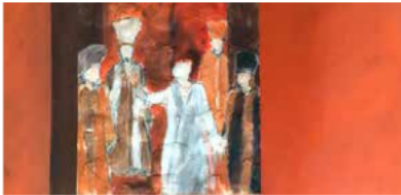
Begegnung im Tempel

Zum Jahresende 2022 erreichte uns die gute Nachricht, dass die „Region Aue-Wulbeck“ als ein Gesamtkonzept der Kommunen Lehrte, Burgdorf, Isernhagen und Burgwedel vom Niedersächsische Ministerium für Ernährung, Landwirtschaft und Verbraucherschutz ausgewählt und anerkannt wurde für das LEADER-Förderprogramm zur Entwicklung des ländlichen Raumes. Darin ist auch unser Vorhaben „Außenanlage St. Marienkirche Isernhagen“ als Starterprojekt für die Vergabe von EU-Mitteln enthalten, so dass wir nun in 2023 mit der Antragstellung und Umsetzung befasst sind. Wir freuen uns, diese finanzielle Unterstützung mit ca. 80% der Gesamtkosten für die Realisierung des nächsten Großprojektes der Stiftung nutzen zu können.