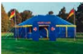
Ihr Team St. Marien

Zum letzten Sommerfest haben unsere Eltern so viele Spenden eingesammelt, dass uns vom 2.-5.5.23 der Mitmach-Circus T-Renz wieder besuchen wird. Am Freitagnachmittag findet die Zirkusvorstellung statt. In einem echten Zirkuszelt heißt es dann: Manege frei für die Kinder der Kita St. Marien! Lassen auch Sie sich bezaubern.