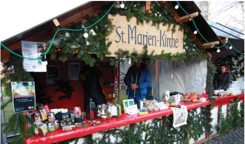
St.-Marien-Stand auf dem Weihnachtsmarkt