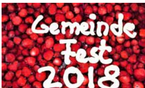
Erdbeerkuchen von Fa. Rathmann, Prosecco am Stiftungsstand