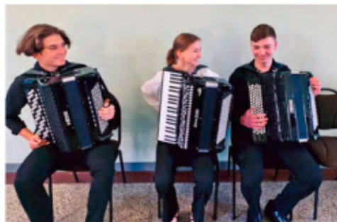
Das Akkordeon-Trio „Buttons & Keys“

Um 17 Uhr wird das Akkordeon-Trio „Buttons & Keys“ der Kreismusikschule Wittenberg unter der Leitung von Victor Bolgov Musik von J. S. Bach, J. Pacalet, A. Piazzolla, „Motion Trio“ u. a. spielen. Durch diese Abendandacht führt Sabine Wichmann vom Kuratorium der Stiftung.