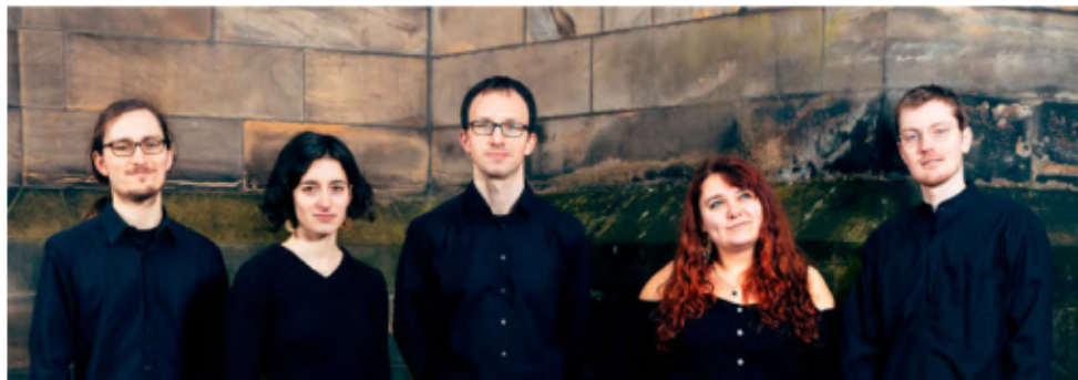
Glen More Ensemble