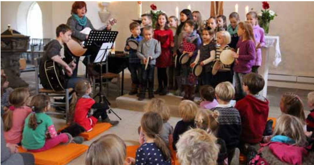
Der Kinderchor St. Marien - hier beim Auftritt in der Kinderkirche zu sehen