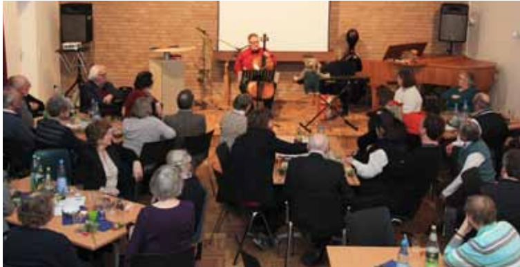
Musikalisches Programm beim Ehrenamtlichen-Abend

wesend sein, wie Kirchenvorsteher/innen im Amt sind (in St. Marien also mindestens 72). Die Versammlung hat eine beratende Funktion. Sie kann Vorschläge und Anregungen an den Kirchenvorstand richten. Wir hoffen daher auf eine rege Beteiligung.