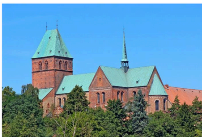
Der Ratzeburger Dom

von Heinrich dem Löwen gestifteten Dome, angeschaut werden.