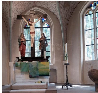
Verschiedene Antependien beim Workshop 2025.

(https://www.ratzeburger-paramenten-werkstatt.de/) Dafür wurde u.a. das freiwillige Kirchgeld 2024 gesammelt.