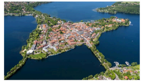
Die Dominsel Ratzeburg

Gemeindeausflug nach Ratzeburg am Samstag, den 11. Oktober 2025, von 9.00- ca. 20.00 Uhr